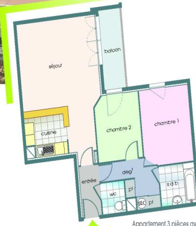
Appartement 3 pièces avec balcon n°A111