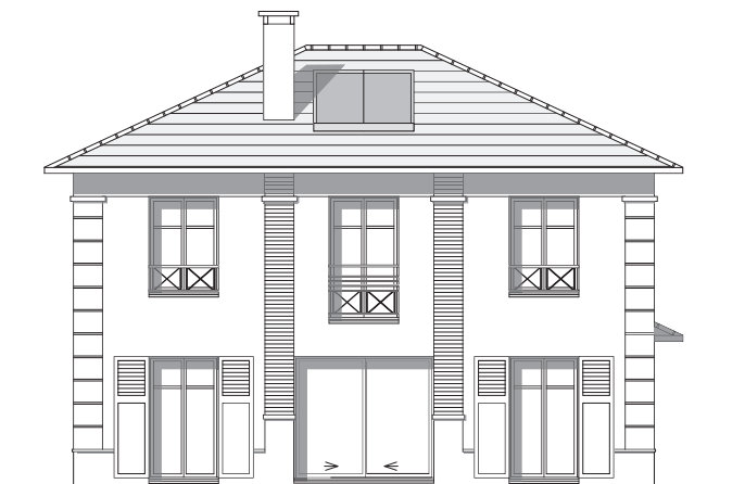
FAÇADE JARDIN - SUD