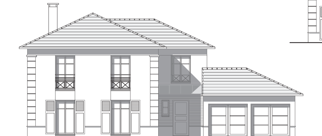
FAÇADE ENTRÉE - EST