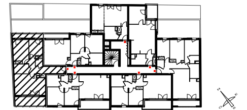
PLAN DE REPERAGE

RÉSIDENCE DE 37 LOGEMENTS 237-239 AVENUE DU GÉNÉRAL LECLERC 94700 MAISONS-ALFORT