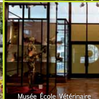
Musée École Vétérinaire

Située au sud-est de Paris, à proximité immédiate de la porte de Bercy, Maisons-Alfort dispose d'une excellente situation. Facile d'accès par la route (N19, A86, A4) ou les transports (métro, bus, RER), la ville offre une qualité de vie exceptionnelle aux portes de Paris. Dotée de toutes les structures administratives, scolaires, sportives et culturelles, elle