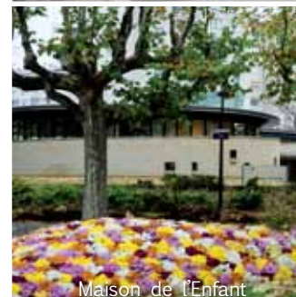
Maison de l'Enfant