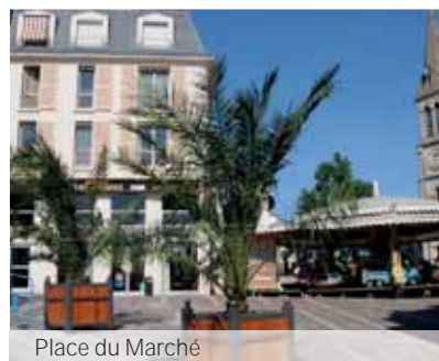
Place du Marché

Une terre riche d'émotions au caractère résidentiel, sécurisé et animé.