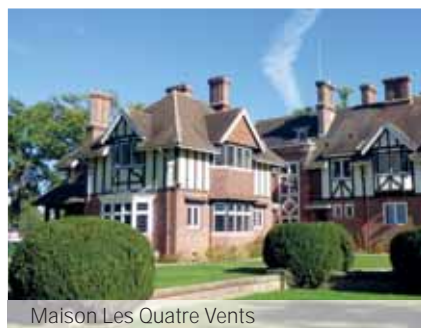
Maison Les Quatre Vents