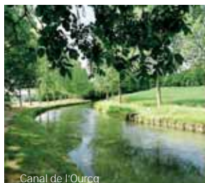
Canal de l'Ourcq