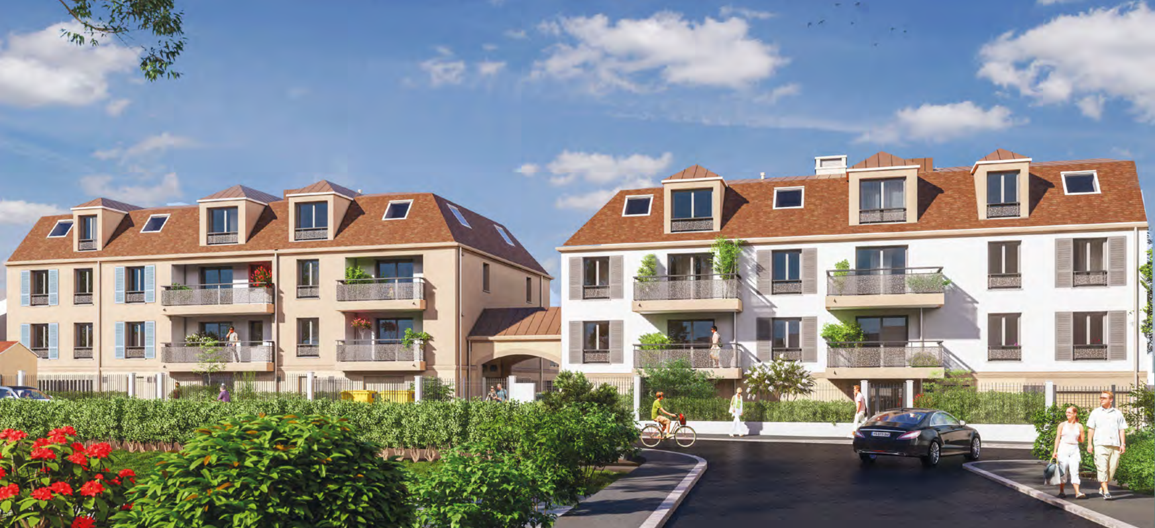
Architecte : MASTRANDREAS Architectes Illustrations : MASTRANDREAS Architectes