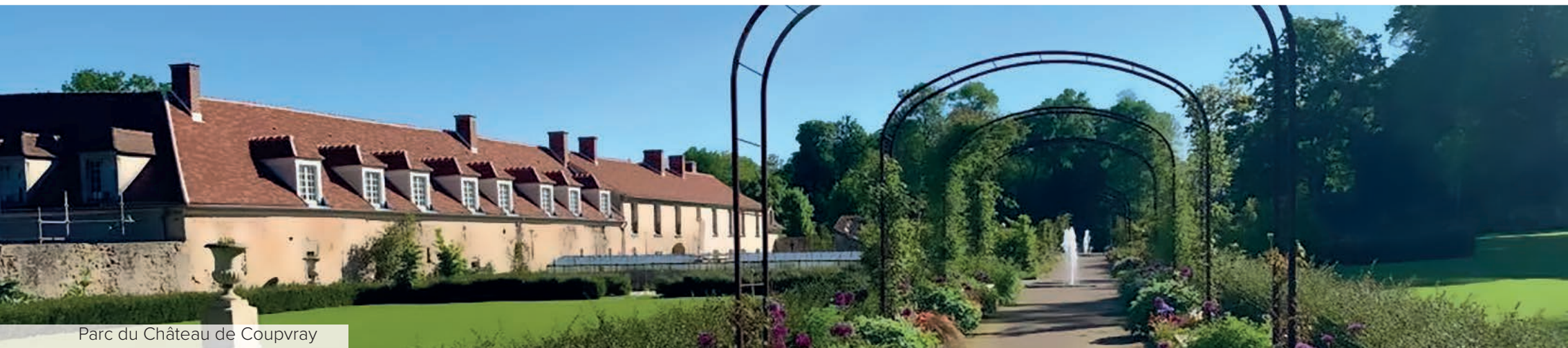
Parc du Château de Coupvray