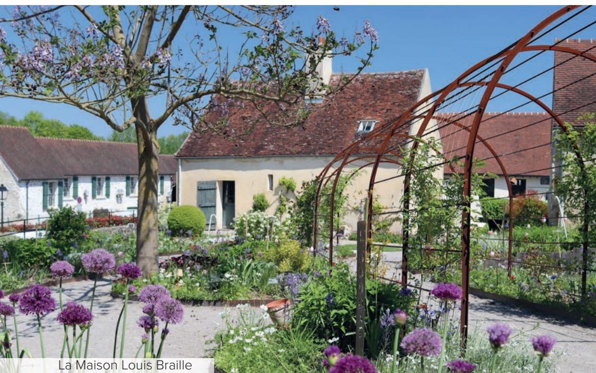
La Maison Louis Braille

Coupvray bénéficie d'une situation stratégique au cœur du Val d'Europe , territoire prisé pour sa vitalité et pour sa qualité de vie. La commune, desservie à proximité par le RER A et par le Transilien P , accueille une partie du parc de Disneyland Paris , première destination touristique européenne.