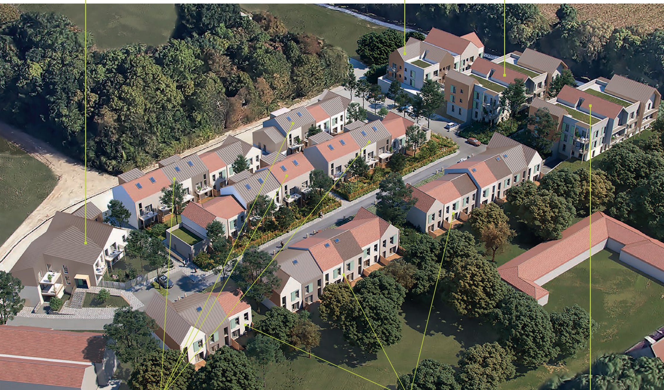
BÂTIMENTS B, C, D, E appartements 3 et 4 pièces