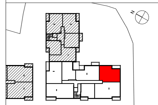
Avenue des Aulnes