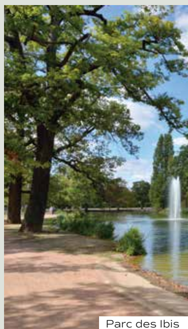
Parc des Ibis